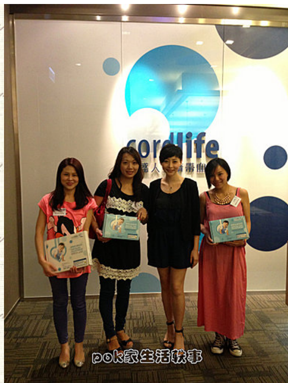
當日仲有好多位blogger 出席,