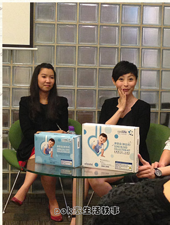
盈盈係一位好 cheerful 好 nice o既明星, 聽佢講湊女經都感受到嗰份愉悅~~