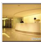
Ewus Facial體驗 - 準備篇！