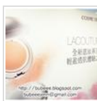
是日活動: COSME DECORTE 全新 LACOUTURE 專屬您的輕盈透肌體驗之旅 LinkWithin

張貼者: bubeee 於 星期一, 7月 22, 2013 在 Google 上推薦這個網址