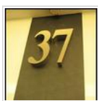
Ewus Facial體驗 - 實戰篇！（附血腥圖* - 慎入）